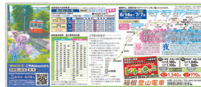
箱根登山電車全5段