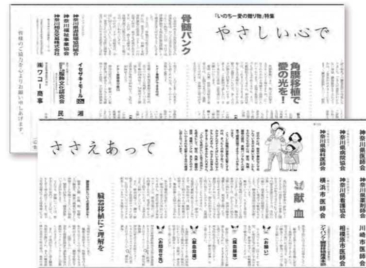
『いのち一愛の贈り物』特集全5段×2(右ページ・左ページ)